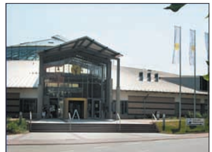
Naumburg, Hallenbad ›Bulabana‹