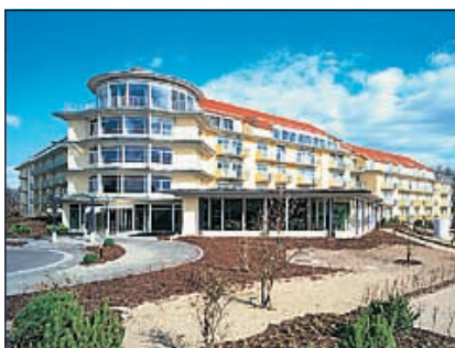
Malchow/Mecklenburg Reha-Zentrum, Klinik ›Malchower See«