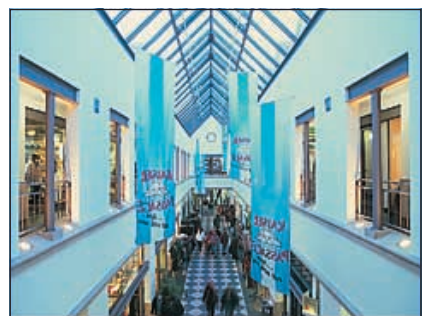
Goslar Einkaufszentrum ›Kaiserpassage«