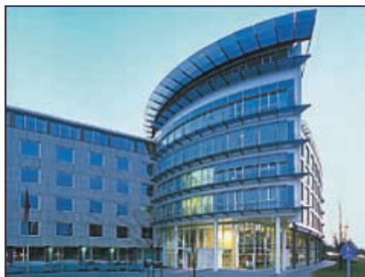
Hannover, Verwaltungsgebäude IGBCE