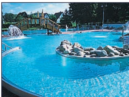
Hiddenhausen, Freibad (BHKWmobil)