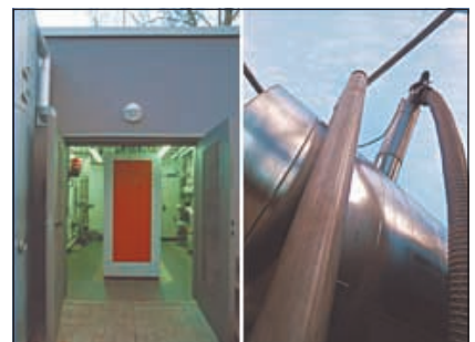
Heidelberg, Zoo (Biogasanlage)