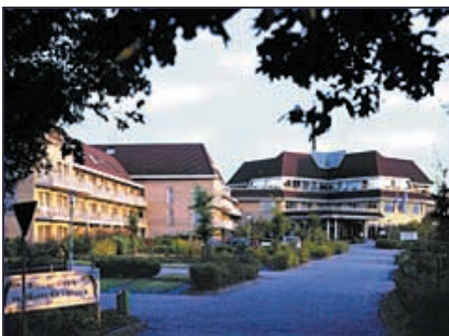
Gladbeck, Hotel ›Van der Valk‹