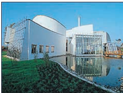
Bad Oeynhausen, ENERGIE-FORUM-INNOVATION E.ON Westfalen Weser AG