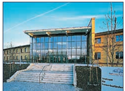
Götz/Berlin Berufsbildungszentrum IHK Potsdam