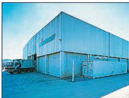
Brilon, Wertstoffsortieranlage (Container-BHKW)