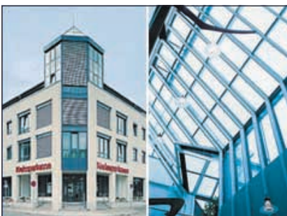
Sondershausen, Kreissparkasse (Kombination mit Absorptionsanlage)