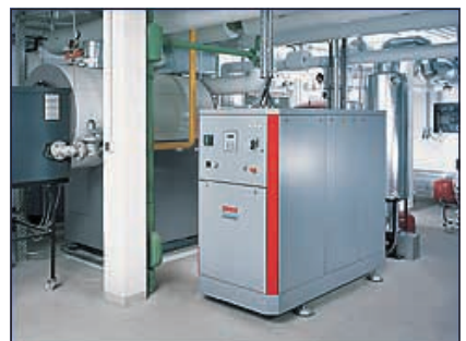
Bielefeld, Nahwärme-Heizzentrale für Neubaugebiet Vilsendorf