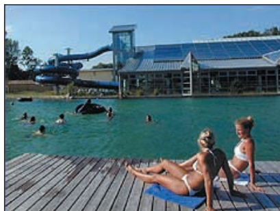
Laatzen, Freizeitbad ›aquaLaatzium‹