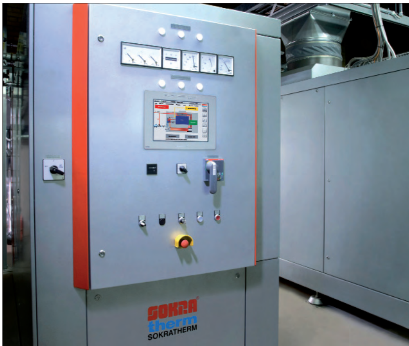
Bild 3. BHKW-Kompaktmodul GG 402 S mit neuer iPC-Steuerung

Eine ähnliche Entwicklung spiegelt sich auch in der von SOKRATHERM ausgelieferten Gesamtleistung wider: Während im Jahr 2000 noch 30 BHKW-Module mit einer Gesamtleistung von rd. 3 000 kW(el) gefertigt wurden, waren es zehn Jahre später über 100 BHKW-Module mit über 16 000 kW(el). In den wichtigsten Märkten erdgasbetriebener BHKW der Leistungsklasse 51 bis 150 und 151 bis 500 kW(el) belegt das Unternehmen im vom Öko-Institut und der Zeitschrift Energie & Management jährlich erhobenen BHKW-Ranking regelmäßig einen der ersten drei Plätze.