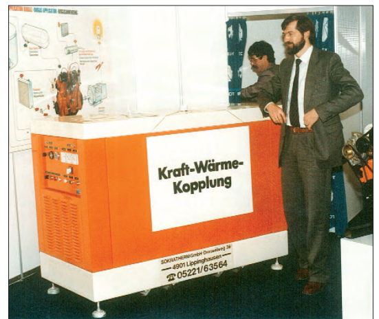
Bild 4. SOKRATHERM auf der Hannover Messe 1984 mit 40-kW-BHKW-Modul für Biogas