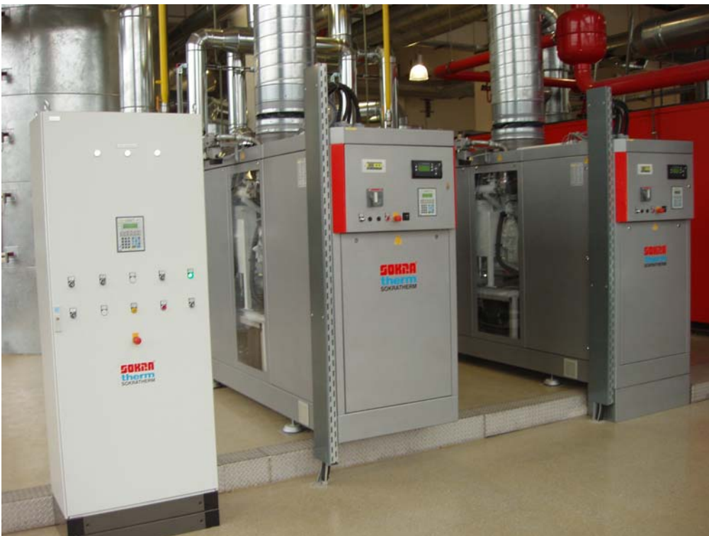
Die installierte Anlage mit MaxiManager Schaltschrank zur Steuerung der Gesamtanlage.