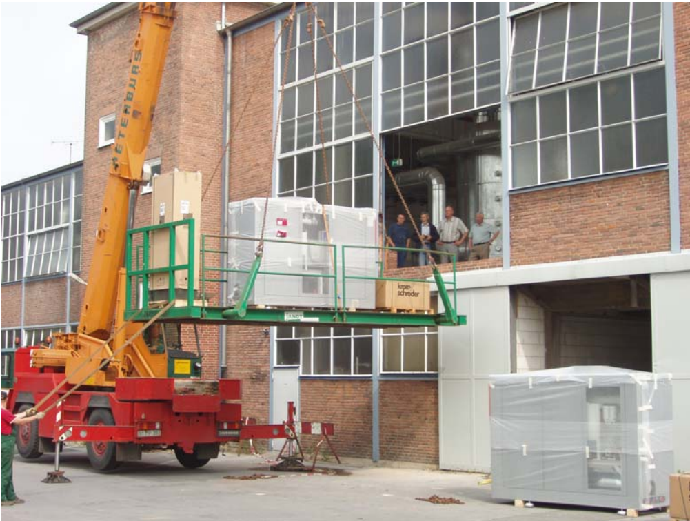
Einbringung der SOKRATHERM BHKW im Juni 2007